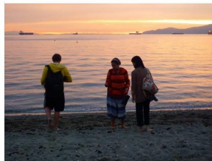
Playas de UBC