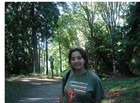
Bosques de UBC